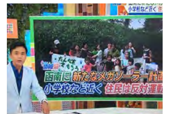
2019.7.5 静岡朝日TV「とびっきり!しずおか」で函南軽井沢メガソーラー問題を特集

これまでに皆様からご協力頂いた署名者数は約3,000筆、これからもよろしくお願ひ致します。 詳細は、facebook、ダイヤモンド区民の会HPで発信中です