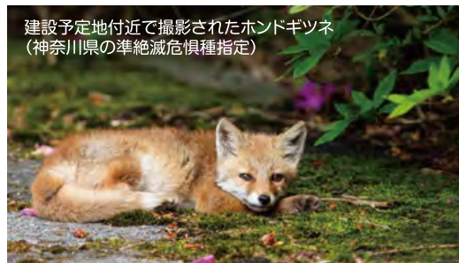
建設予定地付近で撮影されたホンDIGツネ(神奈川県準絶滅危惧種指定)