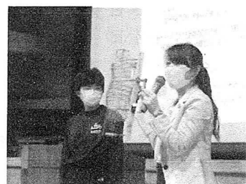
学校保健委員会の様子

よく眠るための秘訣を教えてくださいたり、理想の枕の高さを測定する体験をしたりと、子どもたちにとって、よりよい睡眠を考える機会に