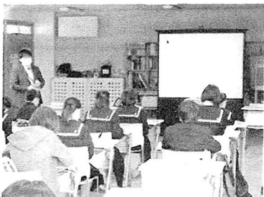
11.26 進路説明会の様子

11月26日（金）に私立高校、12月3日（金）に公立高校という計画で、2年生を対象とした進路説明会が開催されました。子どもたちは、興味のある高校を各日2校選択し、前半・後半に分けて各校の説明会場を巡りました。学校の紹介や求める生徒像など、高校の先生から具体的なお話をうかがい、進路の問題が現実味を帯びてきたことを実感したようです。