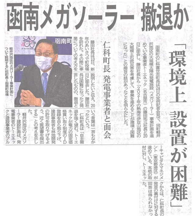
▲伊豆日日新聞(2023年1月25日版)

また、ブルーキャピタルは外資などに事業売却をすることも予想されるだけに、緊張感を持って引き続き函南町や県、それに国と緊密な連携を図りながら建設阻止に向けて取り組んでまいります。